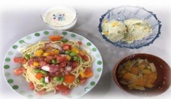
トマトとタコのカップリーニ