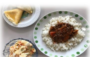
ビーフストロガノフ