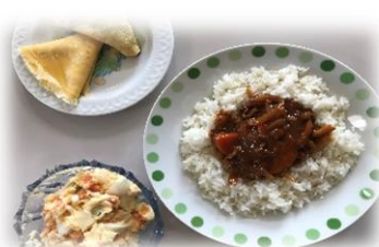
ビーフストロガノフ