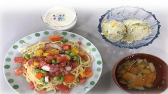
トマトとタコのカッペリーニ